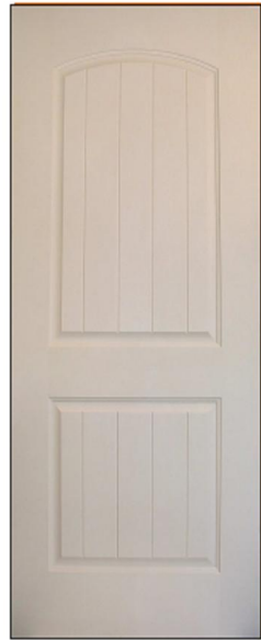
2 pnl. Sierra