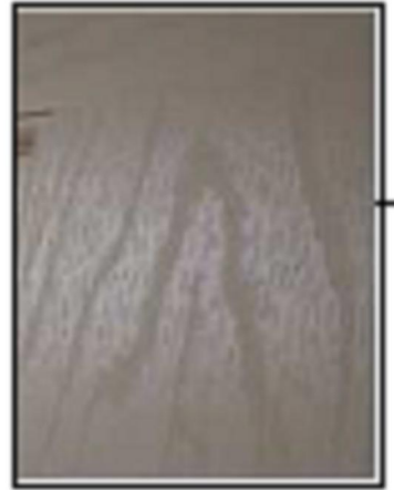
Grabado tipo veta de madera

Puerta de Fibra de Vidrio lisa por ambas caras. Color Primario: Beige.