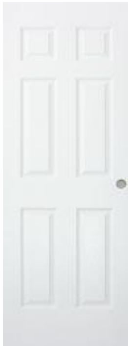
Alpina 6 Paneles