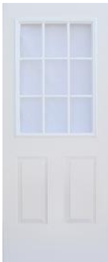
Vitral 9 Luces