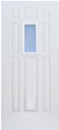
Prisma 9P 1 Luz