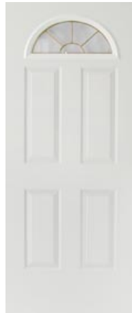
Prisma 1/2 Luna