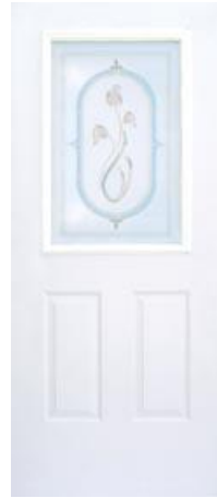
Prisma 1 Luz