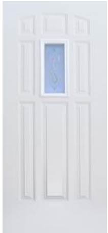
Prisma 9P 1 Luz